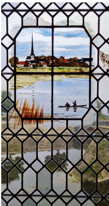
L'après-midi s'est terminée par la visite du musée du cirque et de l'illusion à Dampierre en Burly. Une belle expérience à reconduire...