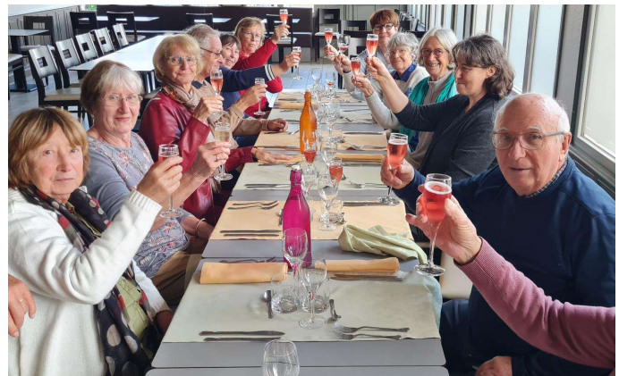
Le repas au restaurant était succulent.