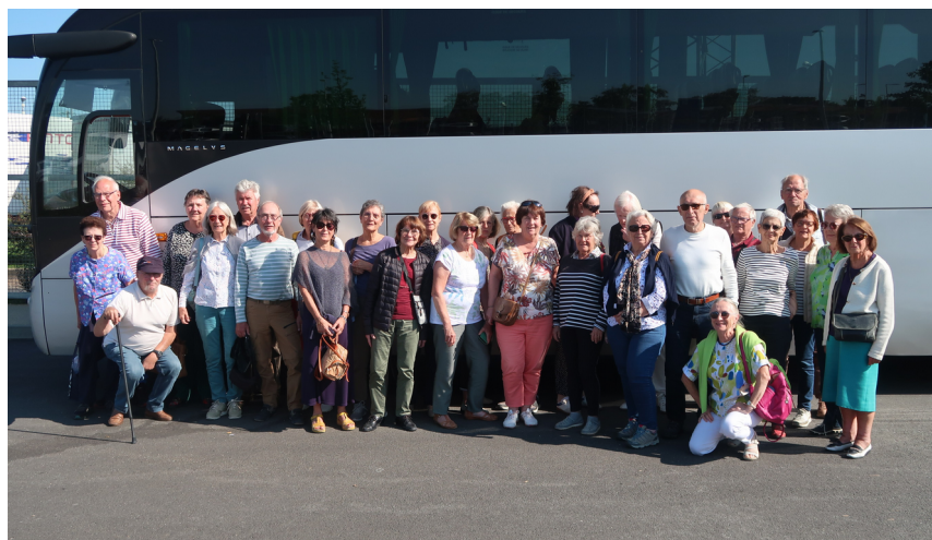
notre groupe 30 personnes-se répartit